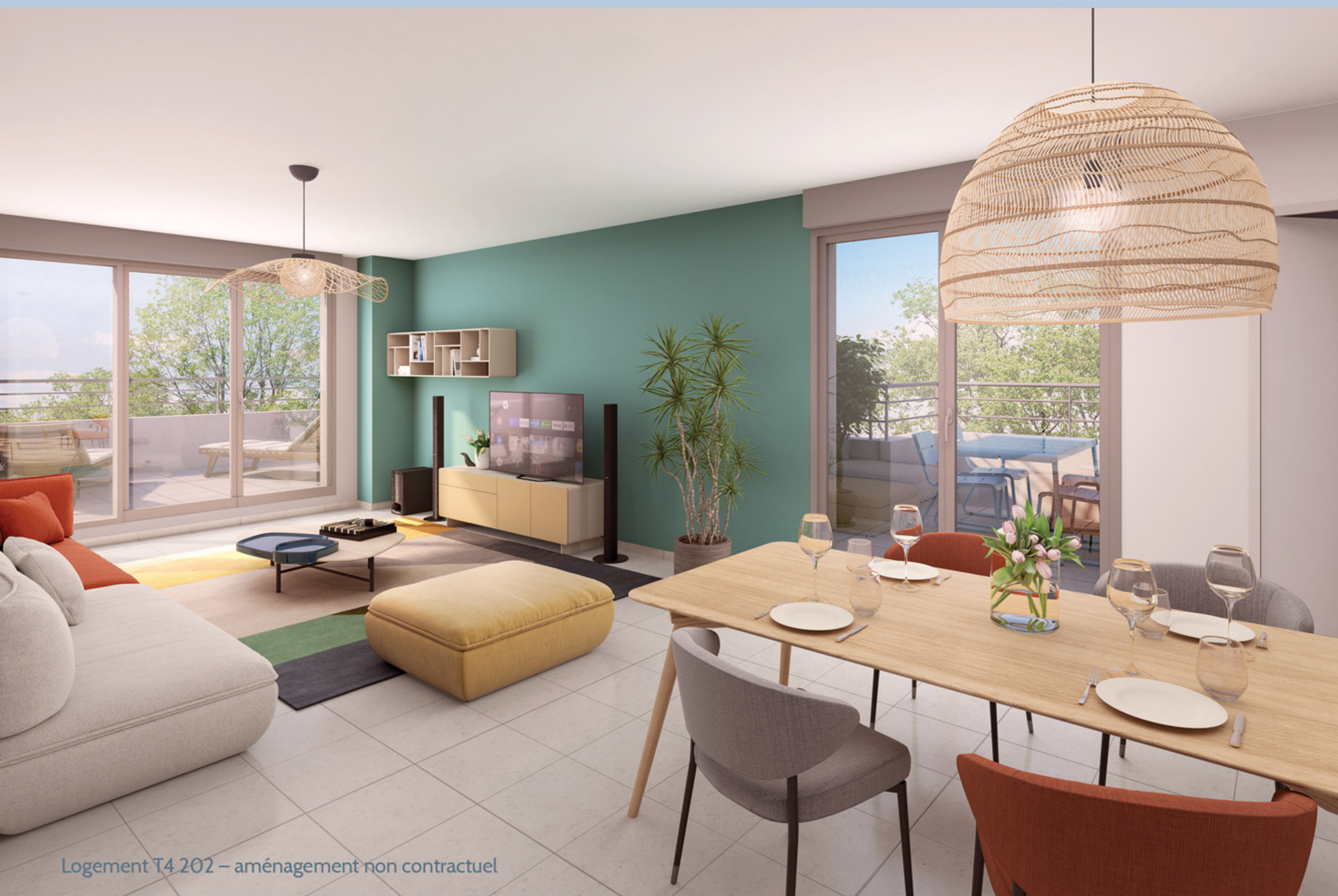
Logement T4 202 – aménagement non contractuel

« LA VILLA » est une résidence close et sécurisée qui présente une architecture contemporaine et élégante, dans l'esprit d'une belle maison à taille humaine et résolument tournée vers le bien-vivre. Les volumes de vie particulièrement importants et la qualité des prestations sont une opportunité rare à saisir sur le bassin de Gueugnon.